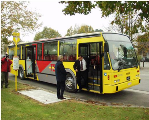
Inauguration le 6 novembre 2006

TEC : Nouvelle Ligne 16 Gare SNCB – Zoning Sud